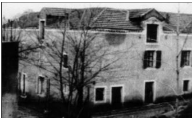
Montée du Zinc * Le Mas du Rat * Acheté par la Compagnie en 1872

Nota: Ces photos des mas ont été prises avant leur démolition, autour de 1987.