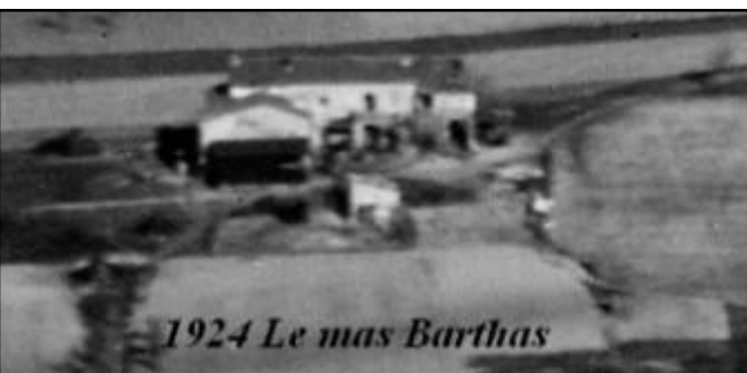
1924 Le mas Barthas