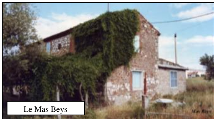
Le Mas Beys