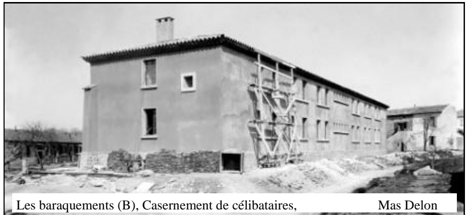
Les baraquements (B), Casernement de célibataires, Mas Delon

L'avenir de l'ensemble pourrait être: Transformation des A, B, C, en sacrifiant 1 pièce sur 3 ou 4 ou 5 ou 6, en installant, dégagements, cabinets, débarras... Tourner B et C vers la place de D (jardins). Démolition de D et éventuellement E. A pourrait être emménagé en magasin cité, avec simple nettoyage des façades, B en centre éducatif, C la plus dégagées en logements