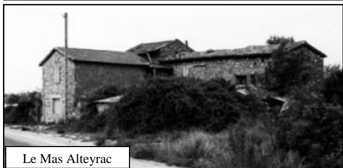
Le Mas Alteyrac