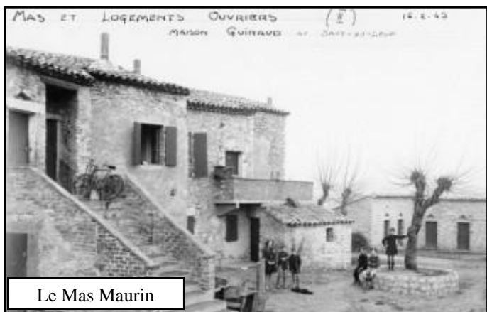
Le Mas Maurin