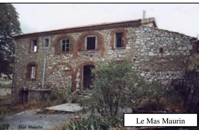
Le Mas Maurin