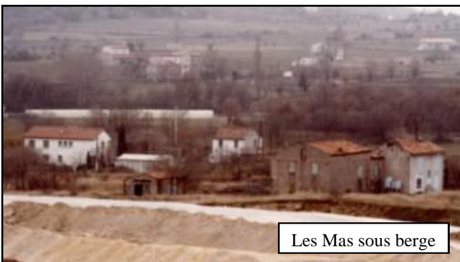
Les Mas sous berge